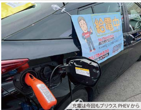
充電は今回もプリウス PHEVから