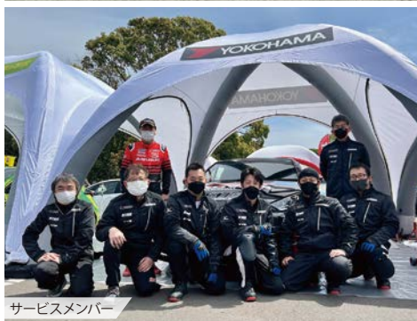
サービスメンバー