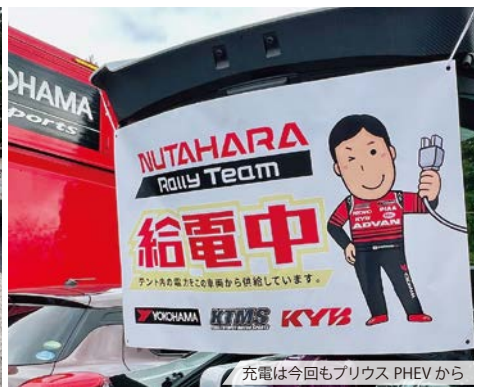
充電は今回もプリウス PHEV から