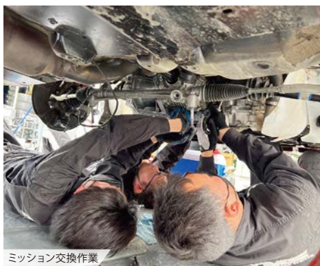
ミッション交換作業