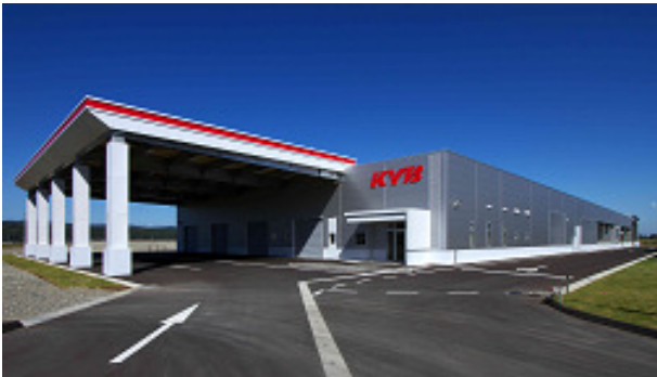
第 2 工場 (車載用 ECU 専用工場)