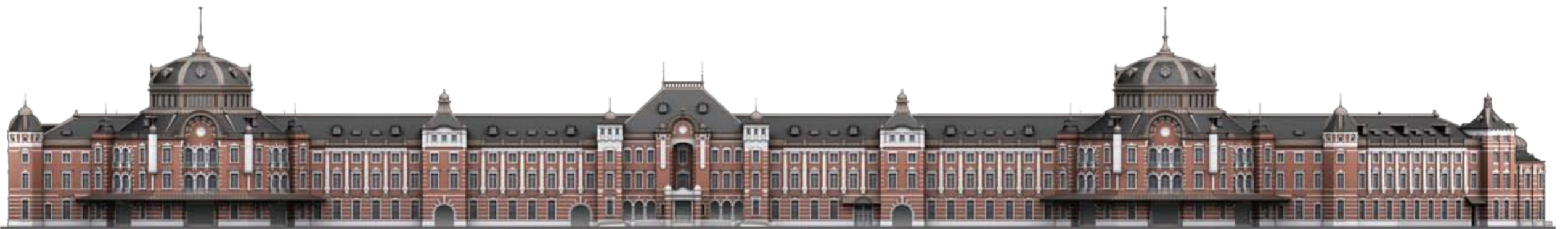
復原された東京駅丸の内駅舎