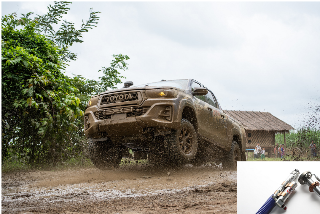
参戦マシン(トヨタハイラックス)