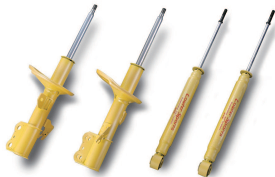
※写真は別の車種のショックアブソーバです。