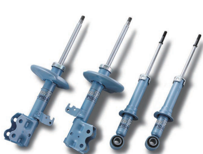
※写真は別の車種のショックアブソーバです。

Lowfer Sports PLUS Suspension Kit system.