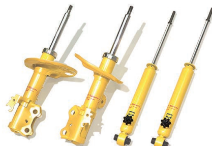
※写真は別の車種のショックアブソーバです。