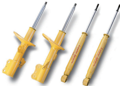
※写真は別の車種のショックアブソーバです。