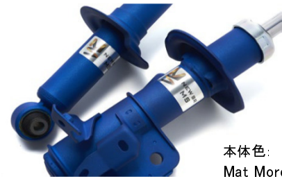
本体色: Mat More Blue