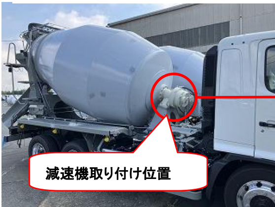
【コンクリートミキサー車 外観例】