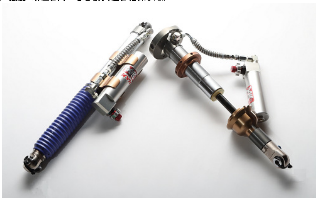
共同開発クロスカントリーラリー用ショックアブソーバ

★過去3年間に及ぶハイラックスでの参戦実績よりダンパ特性を最適化し、悪路走破性を高めると共に、DLCコーティングをピストンロッドに施し低フリクション化を図り、高いドライバーズビリティを実現。更に強度・剛性を向上させ耐久性を確保した。