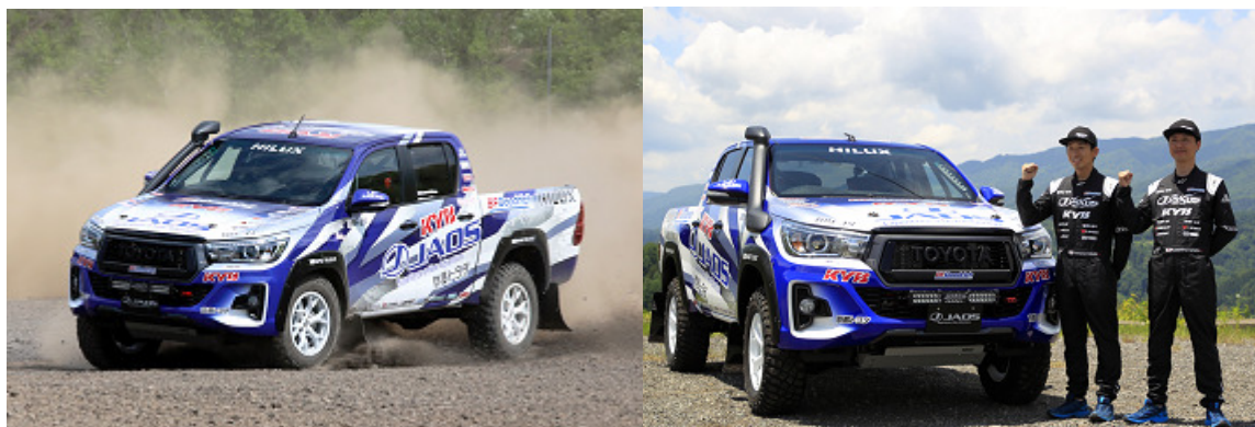
アジアクロスカントリーラリー2019参戦マシン

<KYBおよび「TEAM JAOS」共同開発クロスカントリーラリー用ショックアブソーバ特徴>