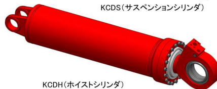
KCDH(ホイストシリンダ)