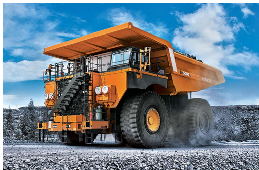
日立建機株式会社様 EH5000AC-3