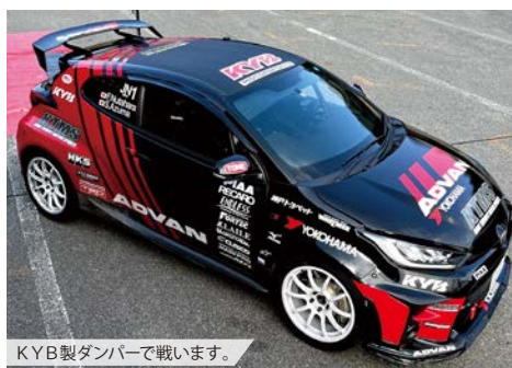
KYB製ダンパーで戦います。