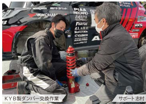
KYB製ダンパー交換作業