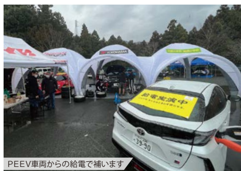
PEEV車両からの給電で補います

昨シーズン終盤の勘が戻っていない所があったので気を引き締めてやっていかなければと思ひました。今回ステージ途中でタイヤ交換があったのですが、初めての経験だったので手間取ってしまいました。コ・ドライバーとしての能力を高めて行くのは勿論ですが、経験を積んで状況を想定した準備を進めていこうと思ひます。