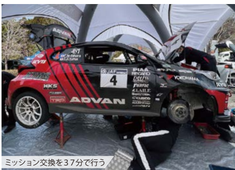
ミッション交換を37分で行う