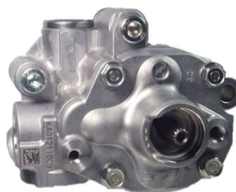
カヤバ製ベーンポンプ (CVT 赤枠内部に位置するユニット内部に搭載)

小型軽量化については、構成部品を見直し、一部部品の材質を鋳鉄製からアルミ製への変更や、部品点数削減などを行い製品重量-30%を実現しました。ポンプの仕事量の最適化、作動油の吸い込み性向上などにより駆動トルクの 10%低減に加え、騒音の改良により静粛性を向上しました。これらの改善により車両の環境性能向上に貢献しております。